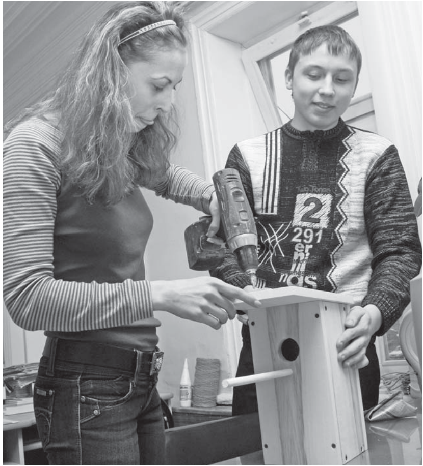
С "Искрой" скворцам теплее

Коли объявила редакция конкурс «Скворец» — самим и участвовать. Неужто «Искра» своими руками, да не сможет сколотить скворечник. Фи! Не тут-то было. Да не заржавеют в наших руках инструменты. Раздобыли дощечки, шуруповерт с саморезами из дому притащили.