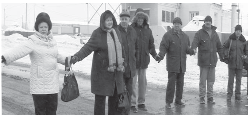
Возьмемся за руки...