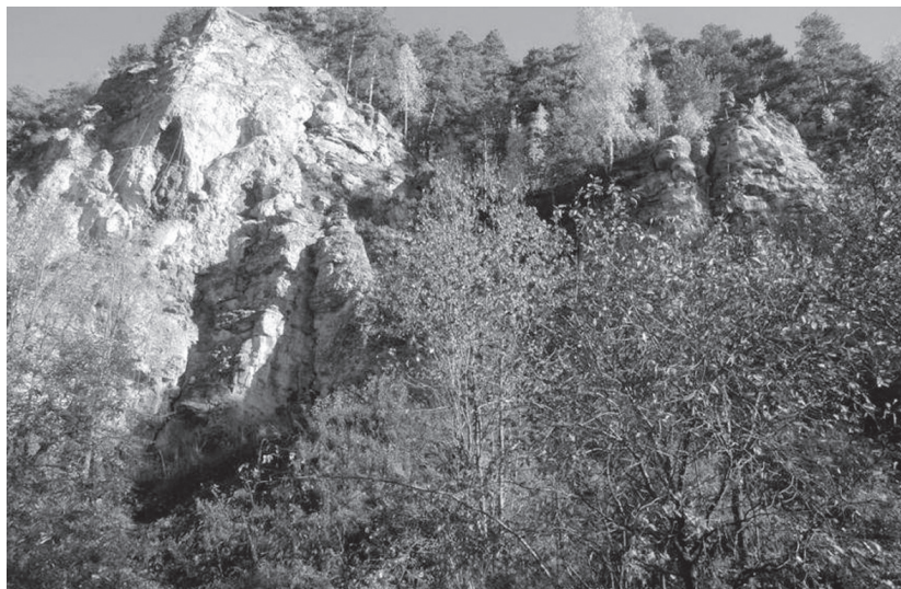
Камень Ермак. С помощью изучения строения таких рифов ученые открывали месторождения нефти

Большое стратегическое значение для победы в войне имели работы по изучению Волго-Уральской нефтегазоносной провинции (так называемого «Второго Баку»), способствовавшие открытию ряда новых нефтяных месторождений. Зачастую залежи нефти в этом регионе связаны с погребенными ископаемыми рифами.