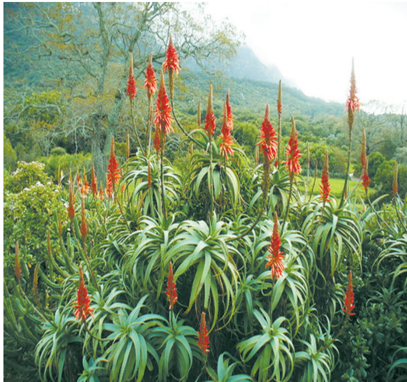
Алоэ - житель Южной Африки

Алоэ с медом: 1 кг листьев алоэ 3-5-летнего возраста промыть, обсушить, срезать боковые шипы, пропустить через мясорубку, залить в стеклянной банке 0,5 кг майского меда и 1,2 л крепкого красного вина, плотно закрыть и выдерживать в темном прохладном месте 5 дней. Принимать для профилактики рака