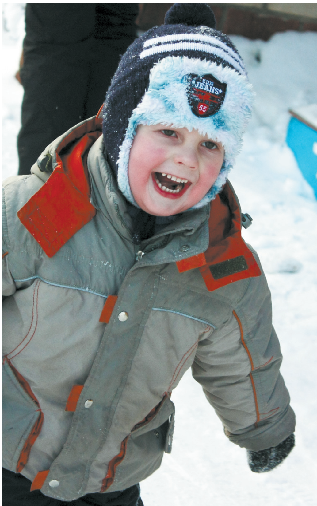
Ура! Гулять пора!