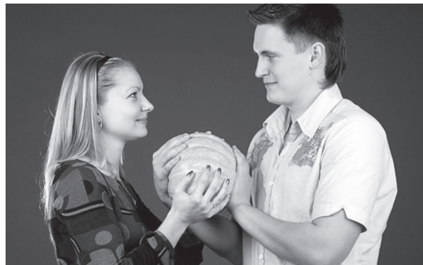
Тыква - кладезь витаминов и оранжевое настроение

Вы избавитесь от подавленного настроения и избежите спада работоспособности, если окрасите себя теплыми красками - желтой, оранжевой, красной. Именно эти цвета помогают встрепенуться, избавиться от усталости и депрессии. Стоит повесить на окна яркие занавески, устроить на подоконнике «зеленые полянки» из комнатных цветов - и хандру снимет как рукой.