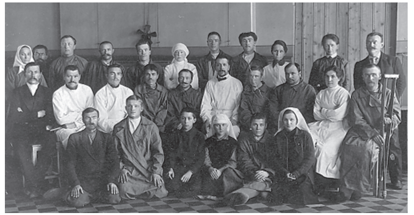
В лазарете города Кунгура, примерно в 1915 году