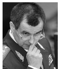
Рашид Нургалиев, министр внутренних дел России

143-е место из 180 стран занимает Россия по уровню коррупции (по данным агентства Transparency International). В Генпрокуратуре заявляют, что главные коррупционеры – госчиновники.