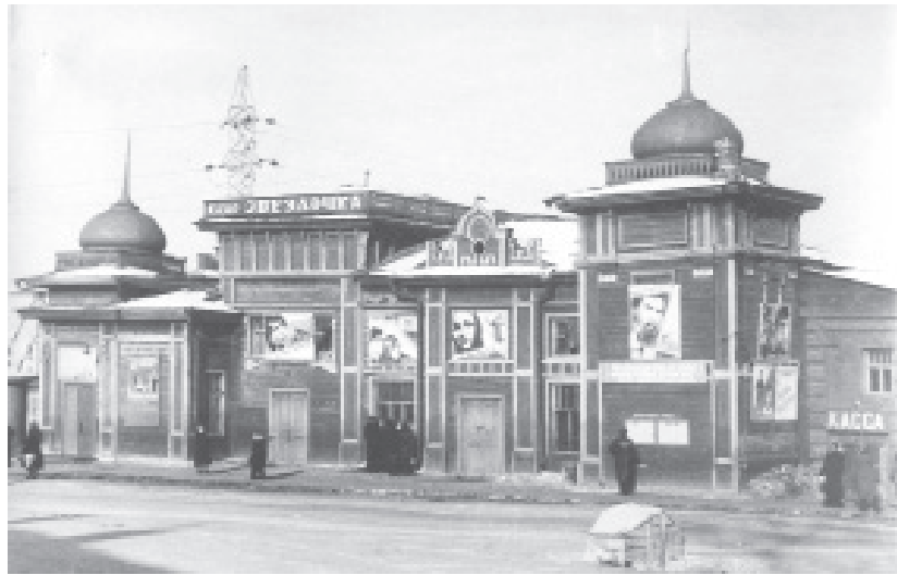
Кинотеатр «Олимп» построили на берегу Сыльвы в 1913 году, в 1923 переименовали в «Пролетарий», через 30 лет стали звать «Звездочкой». В 1969 году снесли, сейчас здесь набережная у «Кораблика»