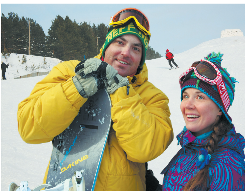
Кунгур к олимпиаде готов!