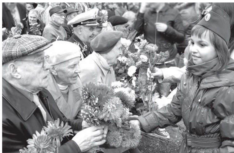
Детей легче собрать в учебный день