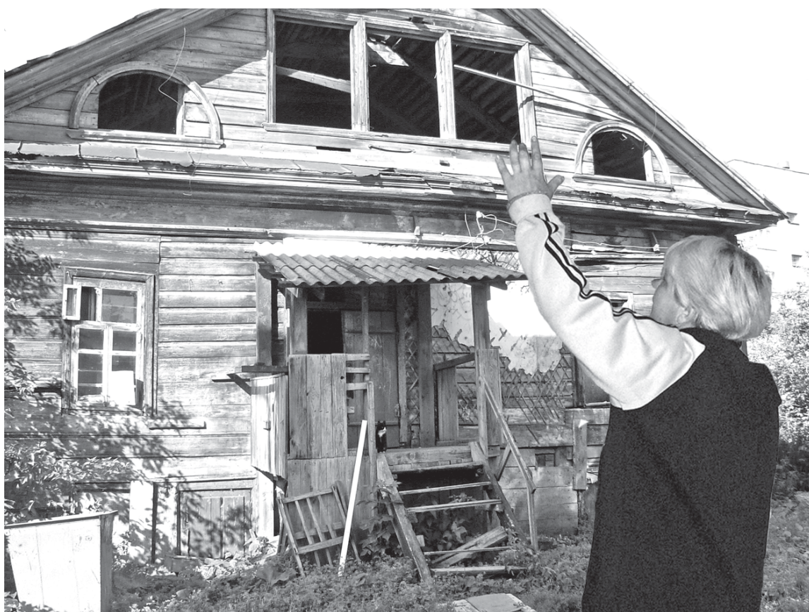
Коплаж: Ирина Соловьева