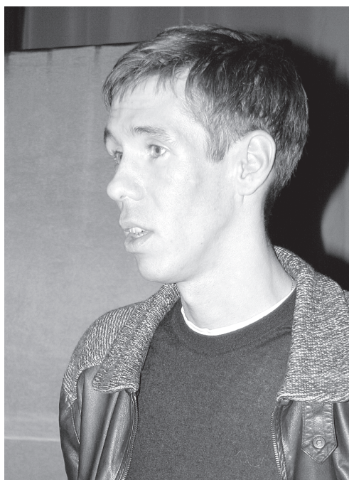
После спектакля зрители наиболее активно фотографировались с Алексеем Паниным

- Деньги были нужны. - А что вы вообще думаете о режиссере Балабанове (помимо фильма «Жмурки» снял картины «Про уродов и людей», «Груз 200», «Морфий» и т. д.)?