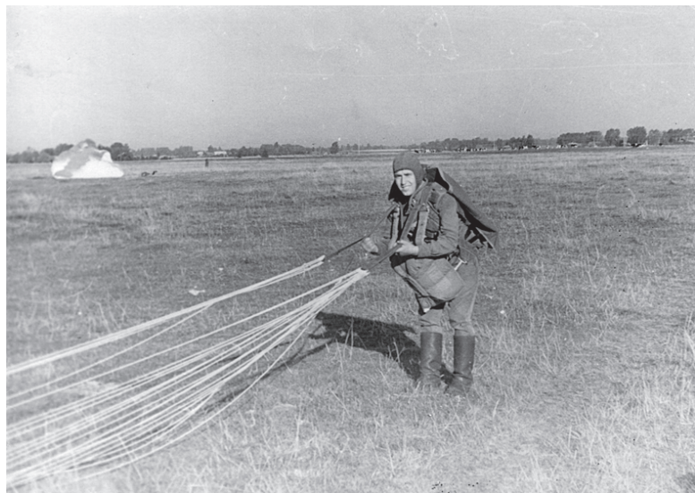
Мы участвовали в съемках фильма о десантниках «Прыжок на заре»

- Стихи до сих пор писать не бросил, хотя пишу чаще по каким-то памятным датам друзьям и знакомым. И если кому-то доставляю удовольствие, мне и этого достаточно. Младший внук тоже делает попытки поздравить деда, набирая рифмованный текст на компьютере. И в его жизнь вошел спорт. И весьма серьезно. В свои 12 лет является чемпионом Санкт-Петербурга среди школьников по дзюдо. Появилась в доме полка, на которой выставлены первые кубки и первые медали юного борца. А если учесть, что в гимназии он отличник учебы, то это радует не только родителей, но и деда. Жизнь продолжается.