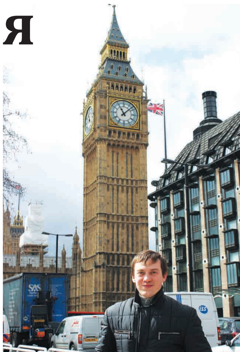
Английские «куранты» - знаменитый Биг Бен

От дорогого транспорта англичане уезжают на велосипедах. Двухколёсный личный транспорт тут в моде. Если уж мэр Лондона ездит на работу на велосипеде, что уж говорить про рядовых горожан.