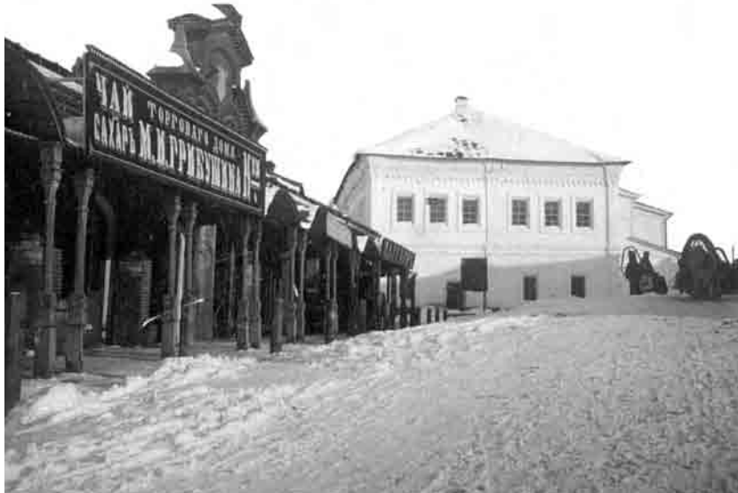
Один из немногих дореволюционных снимков

Здание краеведческого музея раньше было домом не воеводы, как принято считать, а бургомистров.