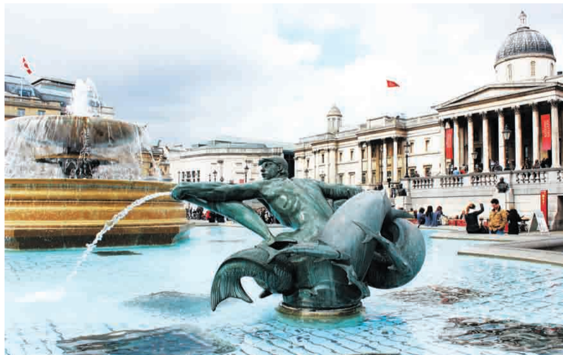
Трафальгарская площадь и национальная портретная галерея ежедневно собирают тысячи туристов со всего света