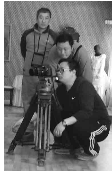
Съемки в музее купечества