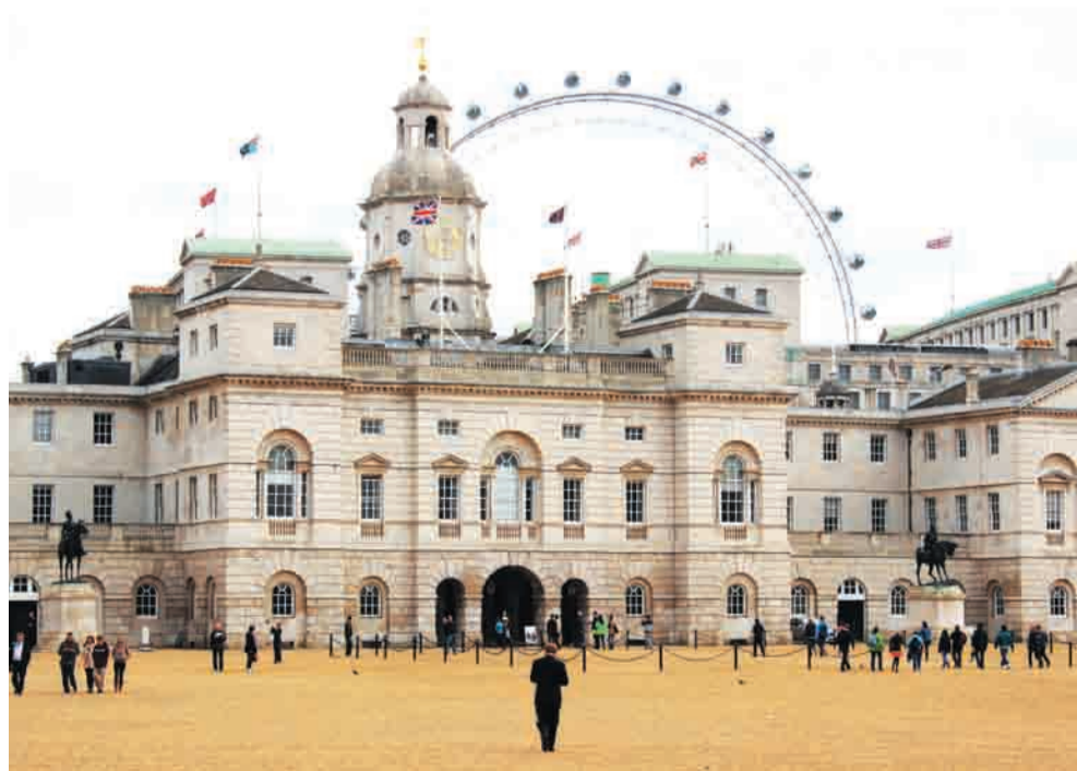
Здание королевских конюшен и одно из крупнейших в мире колёс обозрения - «Лондонский глаз»

Газета «Искра» зарегистрирована управлением Федеральной службы по надзору в сфере связи, информационных технологий и массовых коммуникаций по Пермскому краю. Регистрационный номер ПИ № ТУ 59-0500 от 16 марта 2011 года.