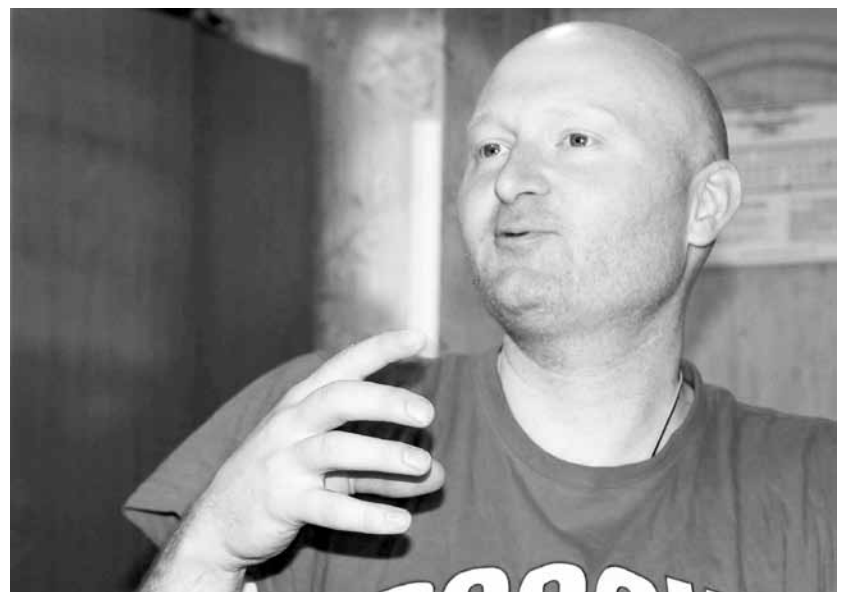
Учусь жить в студенческом общежитии

- Во-первых, я не богат. Высокие налоги мне не грозили. Во-вторых, я лично не знаком с Депардьё. Один раз, правда, пролетел на шаре над его поместьем и виноградниками. Но это не даёт мне право осуждать известного актёра и обвинять в отсутствии патриотизма. Просто один из богатейших людей страны не пожелал отдавать большую часть своих доходов. А Путин оказался весёлым человеком. Шутник он у вас. Или у нас. Сначала пошутил, что такие люди, как Жерар, в России нужны.