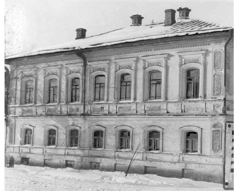
Фото конца 1960-х годов. ВОПРОС. Где находится это здание, кому оно принадлежало, что в нём располагалось ранее и что здесь сейчас?