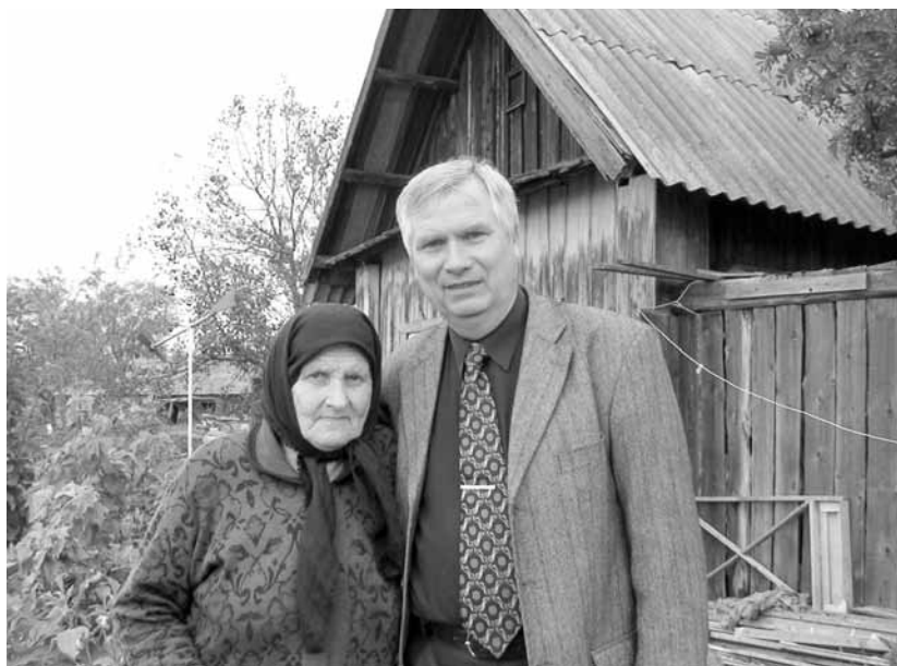
В родном Ленске – с мамой