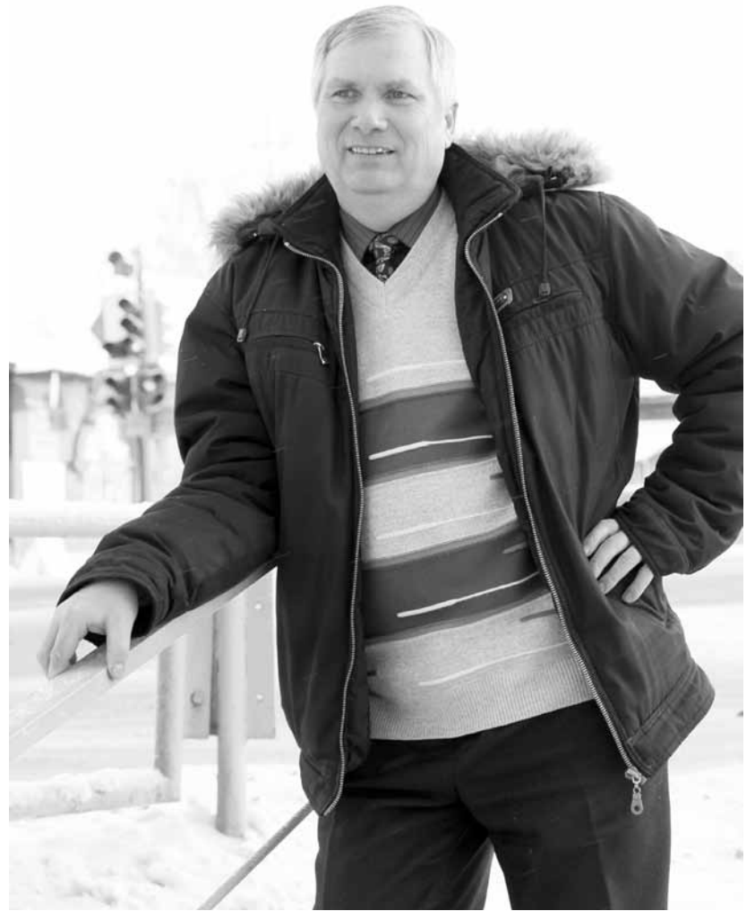
Иван Артюхов: рад, что снова приехал на родину