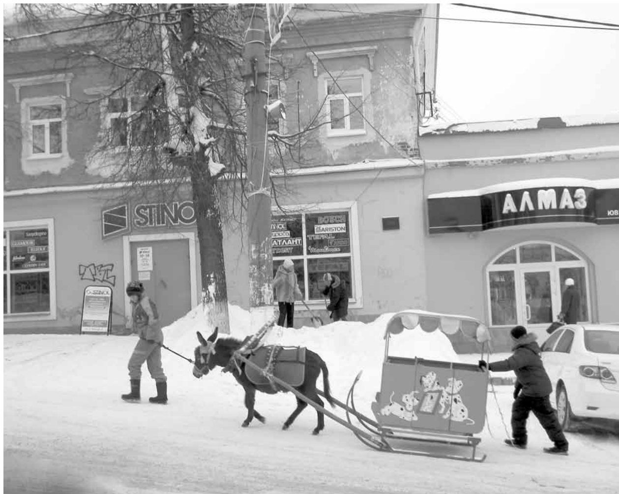
По кунгурским по горам тяжело двигаться осликам...