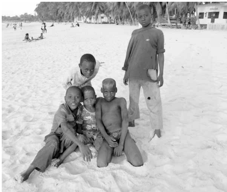
В Мозамбике люди и природа - одно целое