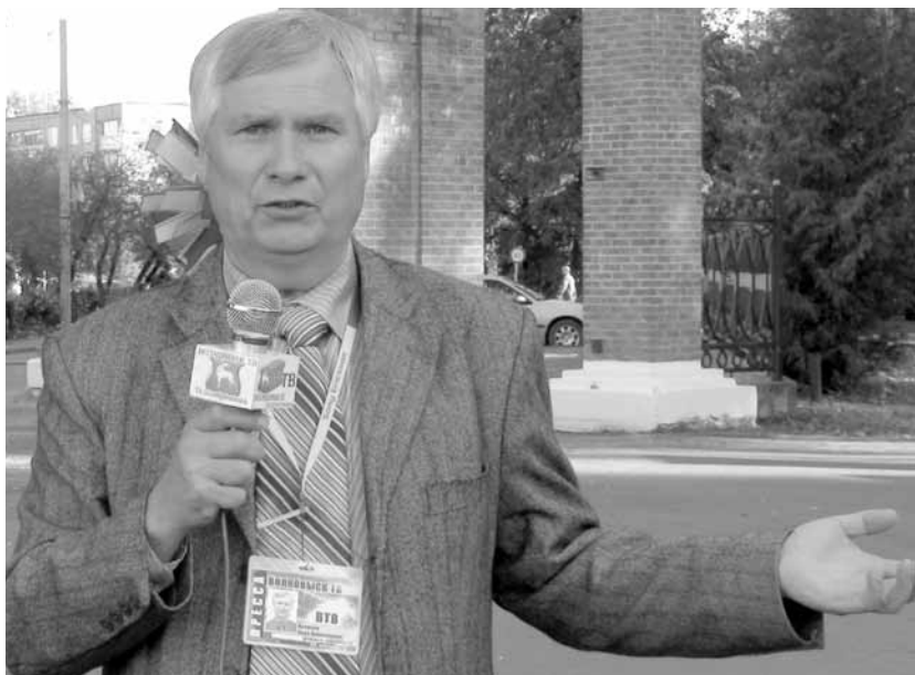
Увлечение стало любимой работой

- Успехов. Больших и маленьких, во всём и везде. Быть внимательными друг к другу, ценить культуру своей страны, больше трудиться. И благосостояние, к которому все так стремятся, тогда обязательно придёт.