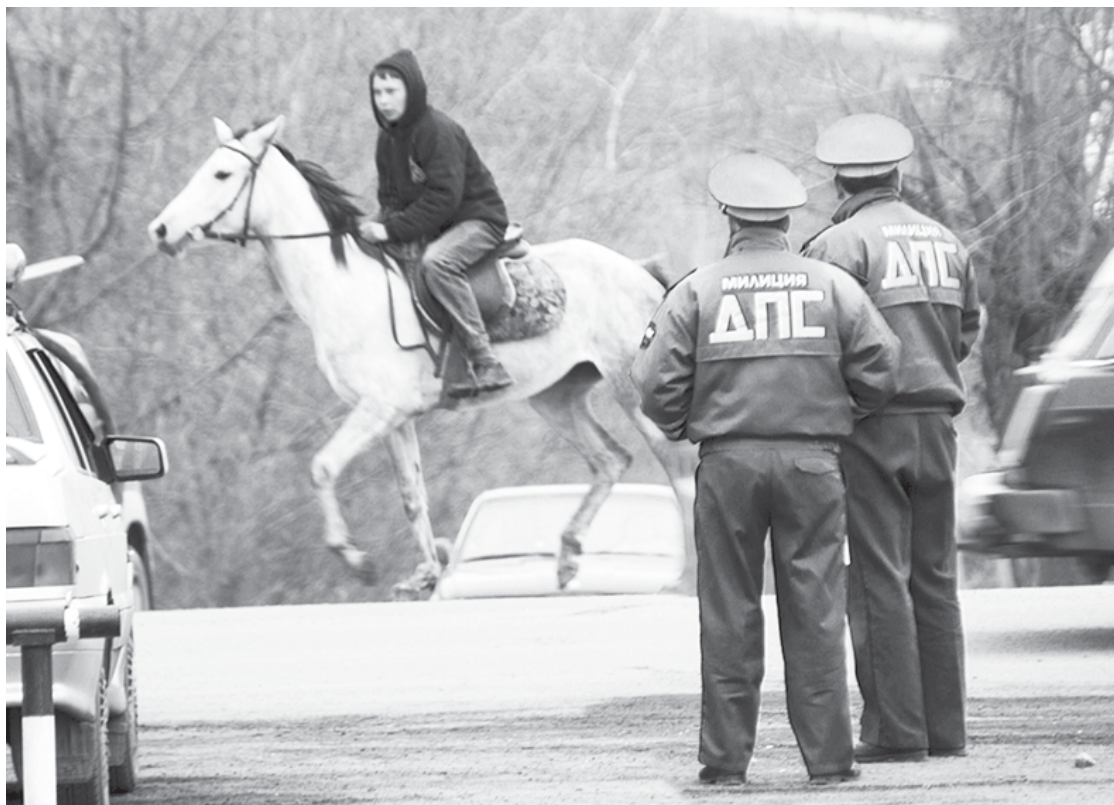
Настоящему ковбою права не нужны!

Права нового образца - такое же национальное водительское удостоверение, как и ныне действующие. Поэтому их введение не отменяет необходимости при выезде за границу получать международные права.