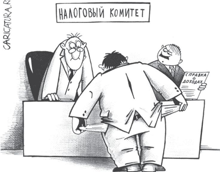
- Смотри какой честный, даже копилку сына указал!...

Цены на основные продукты питания – хлеб, молоко, крупу, макароны, сыр, масло (сливочное и подсолнечное) – стоят на месте. Что не может не радовать. Незначительно подорожал сахар. Но накануне огородного сезона это не удивило.