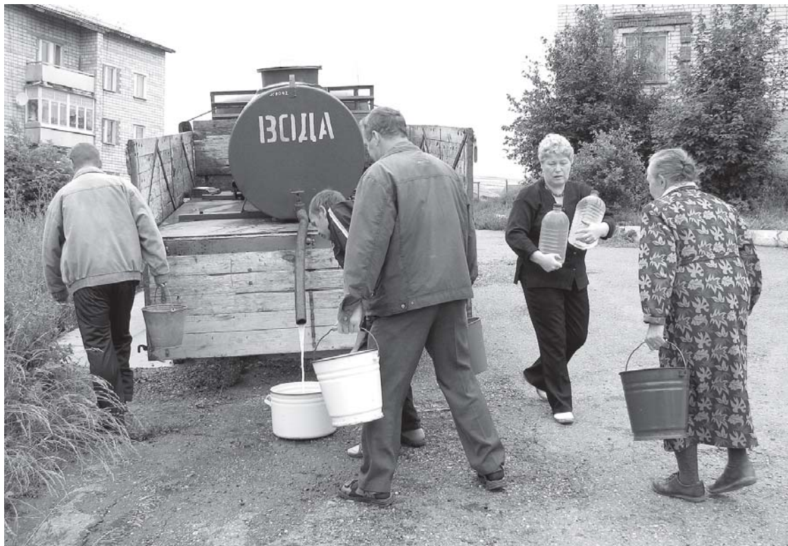
Наконец-то, дождалась. Хотя бы бочку с водой