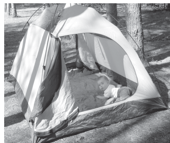
Туристы находят детей не в капусте, а в палатке

- Для очистки воды в лесу можно изготовить простейшие фильтры из нескольких слоев бинта или пустой консервной банки: пробейте в доннышке 3-4 больших отверстия, а затем заполните ее песком. Другой способ: можно выкопать неглубокую ямку в полуметре от края водоема, и она через некоторое время заполнится чистой, прозрачной водой. Хотя надежнее всего – кипячение. Вода в котелке (или ведре) на костре должна непрерывно кипеть не менее 5-10 минут.